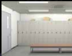
ロッカールームなどに